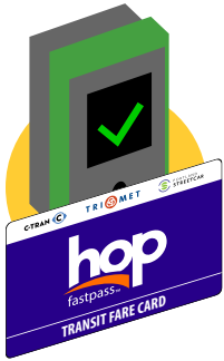
Hop Fastpassカードとリーダー